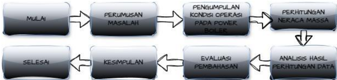
Gambar 1. Flowchart Penelitian

Boiler (celcius), tekanan dari steam yang dihasilkan (Kpa), temperatur steam yang dihasilkan (celcius), komposisi flue gas (%), Feed Water (ton/jam).