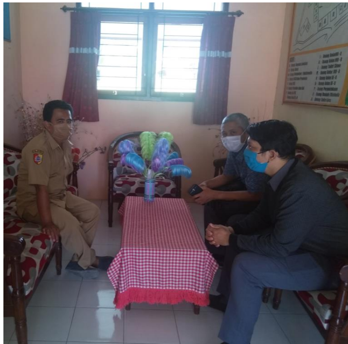
Gambar 2. Persiapan Kegiatan

Kegiatan ini tidak hanya melibatkan guru-guru saja, teknisi dari laboratorium komputer beserta staf administrasi SMP Negeri 2 Arjasa juga ikut terlibat secara aktif dalam kegiatan ini. Salah satu dosen dan teknisi dari Politeknik Negeri Jember yang menguasai keahlian di bidang multimedia menjadi narasumber yang memberikan materi mengenai media pembelajaran digital. Adapun metode pelatihan digitalisasi media pembelajaran yang digunakan adalah metode demonstrasi, sharing dan diskusi, serta praktek atau tutorial (Anriani et al., 2020). Gambar 2 berikut ini menunjukkan koordinasi bersama tim dari SMP Negeri 2 Arjasa membahas mengenai persiapan kegiatan.