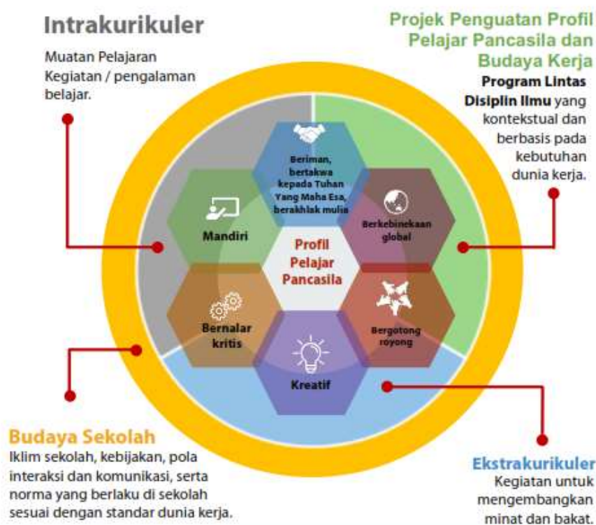
Gambar 1: Skema Profil Pelajar Pancasila pada kurikulum merdeka belajar (Kemendikbud Ristek, 2021).

Profil Pelajar Pancasila secara sederhana digambarkan pada gambar di bawah ini.