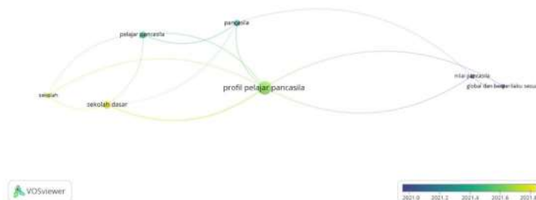
Gambar 3. Overlay Visualization

Overlay Visualization merupakan tampilan yang menunjukkan tren tema terbaru yang sering diteliti dalam tema profil pelajar Pancasila. Tema profil pelajar Pancasila dikaitkan dengan tema sekolah dan sekolah dasar banyak diminati untuk diteliti pada tahun 2021 menuju 2022. Sedangkan tema lainnya sudah terlebih dahulu diteliti pada tahun-tahun sebelumnya yakni tahun 2021.