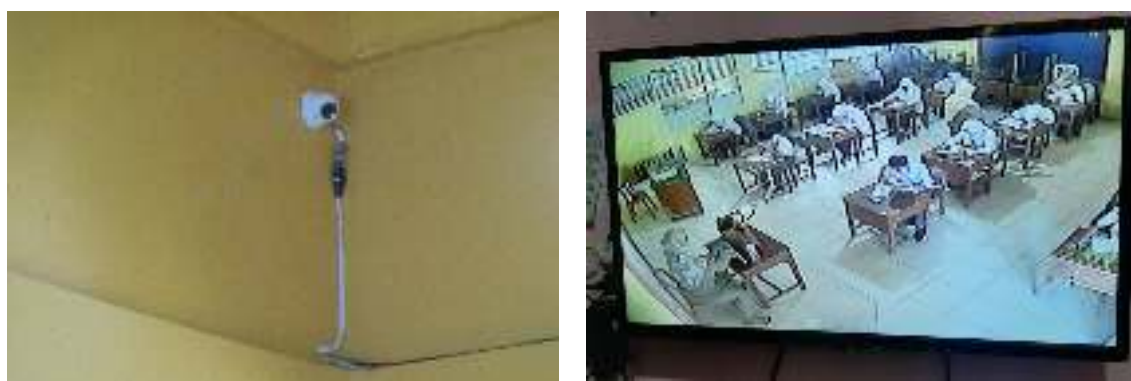
(a) (b) Gambar 4 Kamera CCTV dan Layar Pemantau