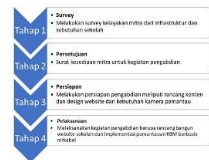
Gambar 2. Alur Proses Kegiatan Pengabdian

Bentuk diagram proses pelaksanaan kegiatan Pengabdian Masyarakat ini dapat dilihat pada Gambar 2 berikut ini.