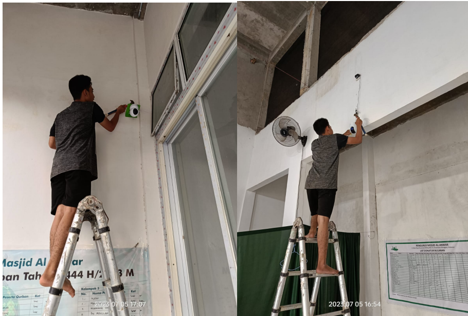
Gambar 2. Pemasangan CCTV di Dua Titik ( Indoor dan Outdoor )