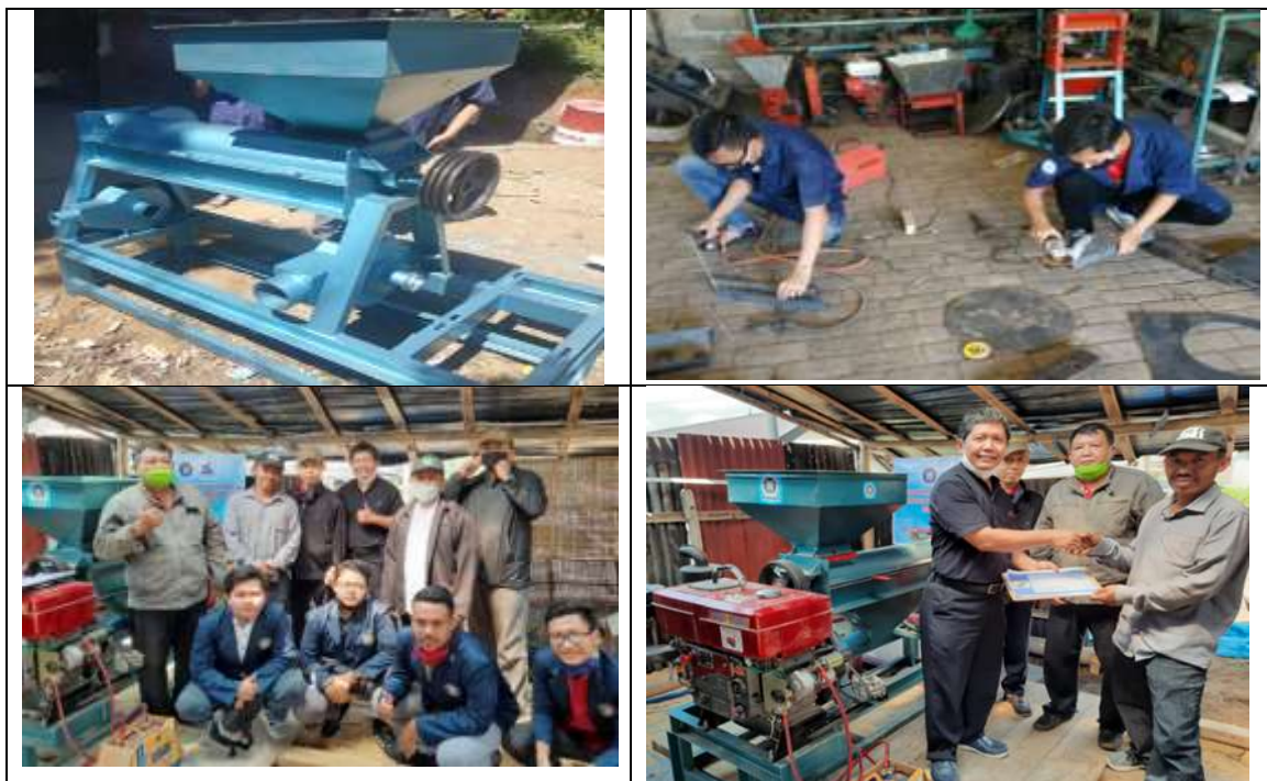
Gambar 6. Tahap Pembuatan Mesin Wet Huller

Tahap pengujian, alat yang digunakan dalam penelitian ini yaitu: mesin wet hulling kopi, nampan, ember, tampah, timbangan digital, tachometer, dan alat tulis. Bahan yang digunakan dalam penelitian ini bijih kopi yang berasal dari mitra kelompok tani Margo Rahayu dan UKM Kopi Posong, Kledung, Tlahab, Kabupaten Temanggung