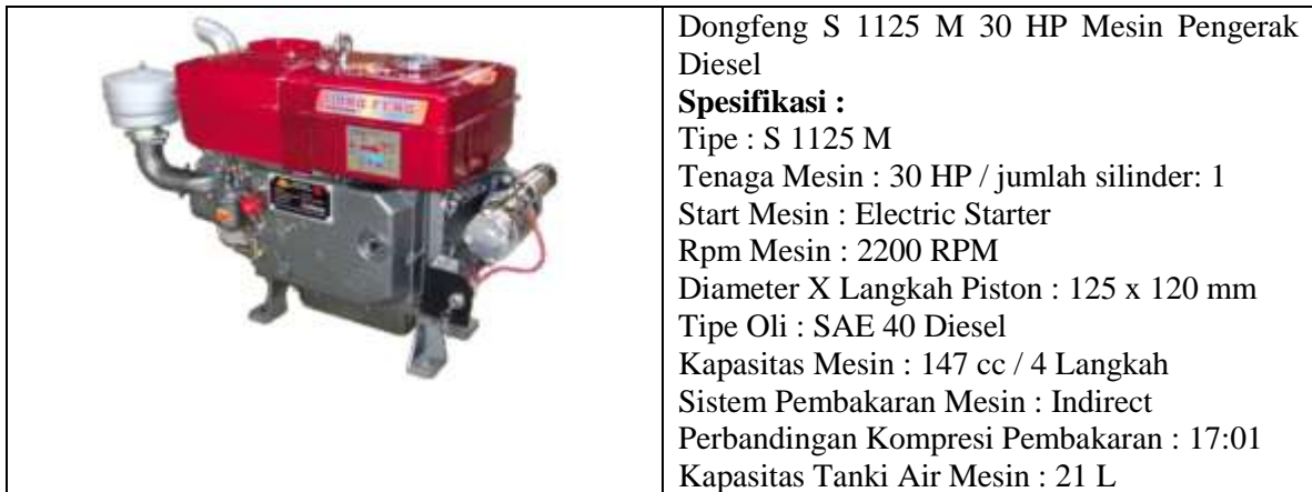
Gambar 5. Motor Diesel penggerak

Tahap pembuatan mesin wet hulling kopi berdasarkan hasil rancangan. Terdapat 2 kelompok komponen yakni komponen yang dibuat dan komponen standar yang dibeli di pasaran. Yang dibuat seperti rangka mesin, corong pemasukan dan pengeluaran, casing huller dan rotor atau pisau pengupas.