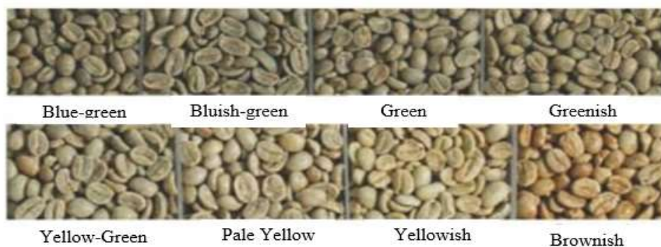
Gambar 4. Gradien warna biji kopi

Syarat nilai cacat. Cacat warna, bau, dan bentuk biji kopi bisa diamati secara visual dan juga dengan indera penciuman. Cacat warna dan bau apek umumnya terjadi akibat serangan jamur saat biji kopi yang dijemur terlalu lambat. Penjemuran yang baik dan terkontrol akan mencegah bau tersebut dan menghasilkan warna biji kopi biru-keabuan ( grayish-blue ) dan atau hijau-keabuan ( grayish-green ).