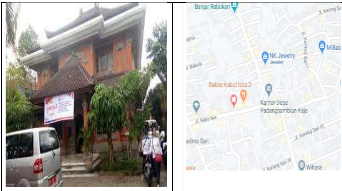
Gambar 1. Lokasi Kantor Kepala Desa Padang Sambian Kaja

Secara geografis, Desa Padangsambian Kaja terletak di wilayah Kecamatan Denpasar Barat, Kota Denpasar, Provinsi Bali. Sebagai suatu desa yang berada di pinggiran perkotaan Kota Denpasar, bentang alam Desa Padangsambian Kaja sebagian besar merupakan areal pemukiman warga, namun pada beberapa wilayah masih terdapat area budidaya, seperti sawah (Subak Pagutan dan Subak Srogsogan), tegalan, kebun, kawasan usaha dan pergudangan dan sebagainya. Luas wilayah Desa Padangsambian Kaja adalah 409 Hektar. Lokasi koordinat pada 115.1899 BT / -8.652808 LS. Terbagi menjadi sembilan wilayah kerja teknis kewilayahan yang disebut dengan Dusun, yaitu : Desa Padangsambian Kaja juga merupakan salah satu desa di Kota Denpasar yang berbatasan langsung dengan Kabupaten Badung, sehingga beberapa batas-batas wilayah Desa Padangsambian Kaja juga merupakan batas wilayah Kota Denpasar dengan Kabupaten Badung.