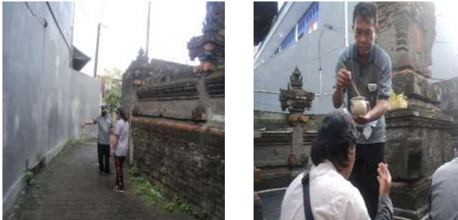
Gambar 2. Kodisi Kawasan Kantor Kepala Desa Padang Sambian Kaja