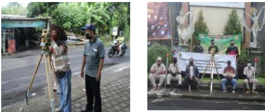
Gambar 3. Kegiatan Pengukuran Kantor Kepala Desa Padang Sambian Kaja

Dalam setiap tahapan pelaksanaan pengabdian diikuti dengan proses evaluasi sesuai dengan jadwal, sehingga luaran dapat diselesaikan secara bertahap dan berkelanjutan.